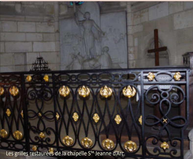
Les grilles restaurées de la chapelle S te Jeanne d'Arc.

Les céramiques et les parties de bois du retable et de l'autel ont été nettoyées et restaurées pour enrayer les dégradations constatées. La dépose des carreaux et leur fixation sur un support sain seront nécessaires pour terminer cette restauration.