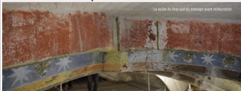
La voûte du bras sud du transept avant restauration

À l'intérieur, l'échafaudage du bras sud du transept atteint les voûtes depuis le début du mois d'octobre. Un nouvel échafaudage a été monté à la croisée du transept. Il atteint maintenant la voûte en bois qui n'est plus visible du sol de la cathédrale. Les travaux de restauration de la voûte du bras sud ont commencé au mois de décembre avec la réfection des joints entre les voûtains.