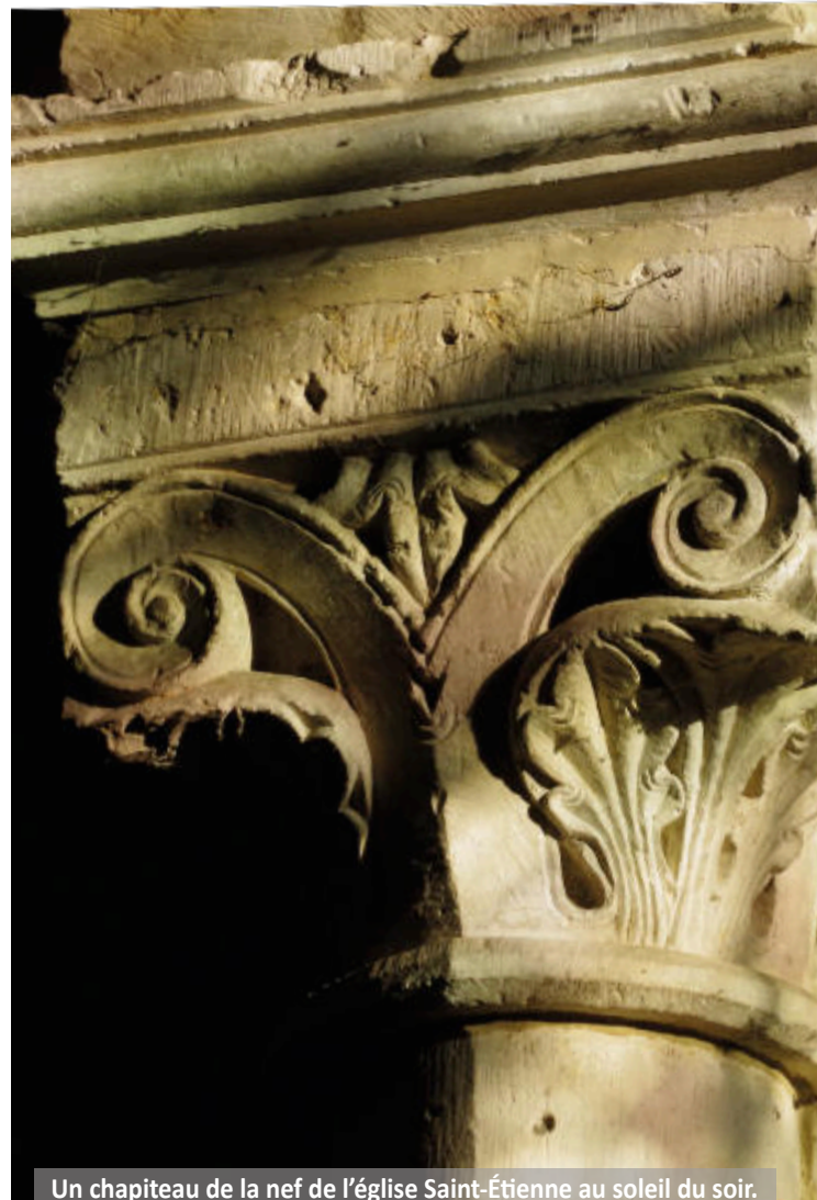
Un chapiteau de la nef de l'église Saint-Étienne au soleil du soir.

Nous vous donnons rendez-vous pour la traditionnelle galette des rois qui aura lieu le jeudi 9 janvier à 18h dans l'église Notre-Dame de la Basse-Œuvre.