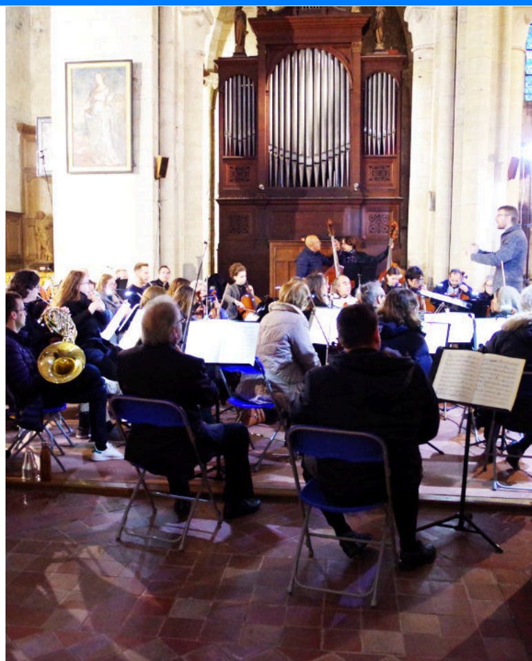
La répétition de Porgy and Bess à l'église Sain-Étienne le dimanche 12 novembre.