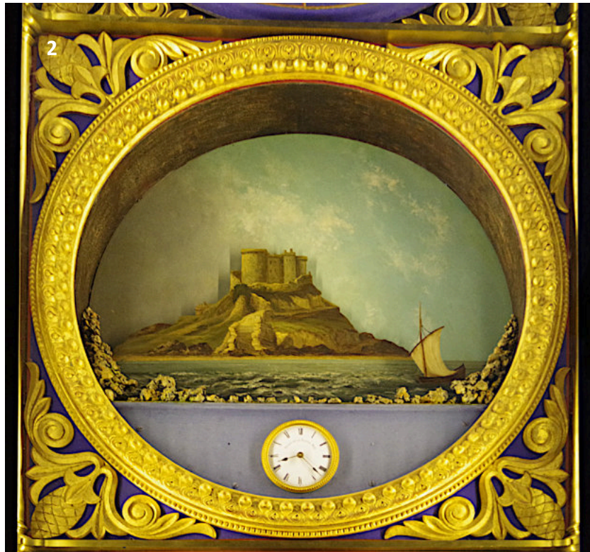
Marée basse au château de Mont Orgueil sur l'île de Jersey. Une bande de sable est nettement visible sous les rochers alors qu'à marée haute, la plage est complètement recouverte par les flots.

Lorsque le moteur de la Vertu (ou du Vice) se met en marche, il tire en arrière le levier (l), ce qui libère le taquet (t) et débloque le pendule (p). Ce pendule commence à tourner sous l'effet de son moteur (mo) dont le tambour tourne sous l'effet du gros poids accroché à son câble (sous l'horloge). Le ressort (r), qui a été tendu à la fin du cycle précédent, aide au redémarrage du pendule. Ce pendule régularise les mouvements de va et vient des éléments mobiles du paysage (vagues et bateau qui tangue) et évite les blocages.