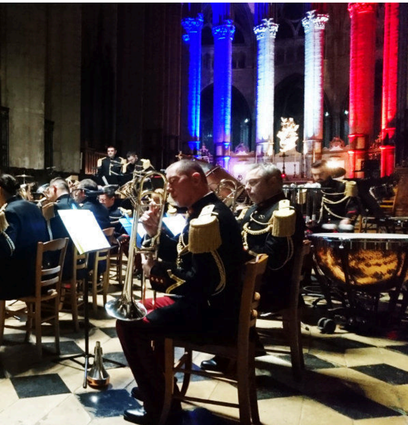
Le concert du 21 novembre au profit des Bleuets de France dans la cathédrale.