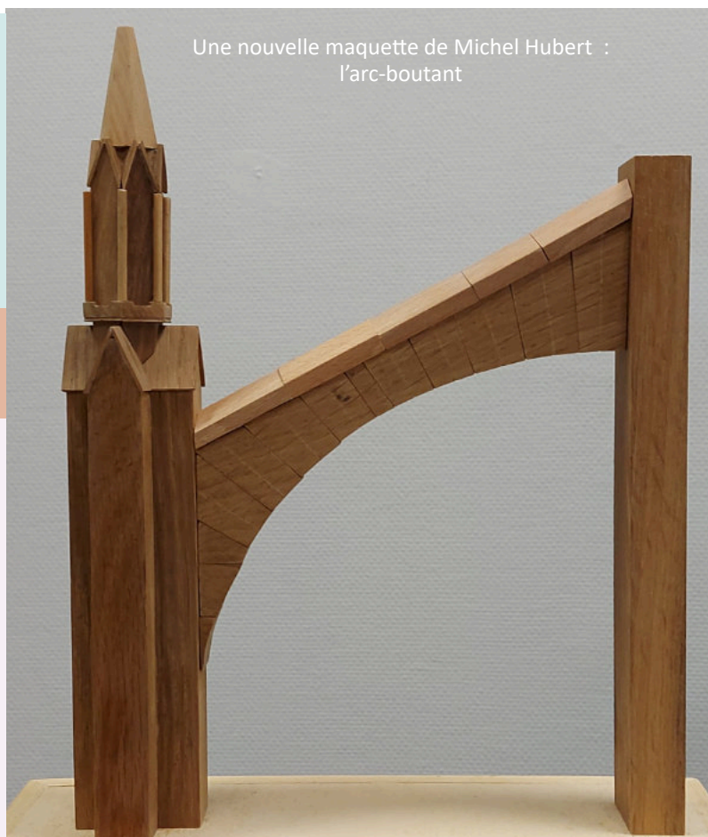
Une nouvelle maquette de Michel Hubert : l'arc-boutant

Pour encourager cette action, ABC organise ces visites à titre gratuit, dans le cadre de son engagement au titre de la Politique de la Ville subventionnée.