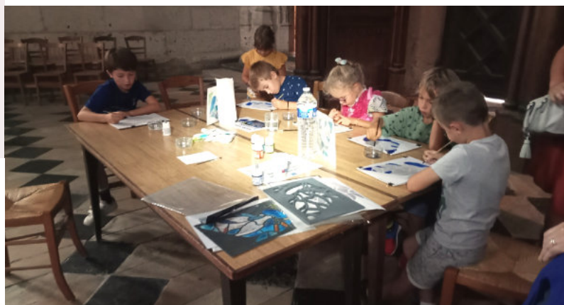
Les enfants fabriquent leur vitrail colombe